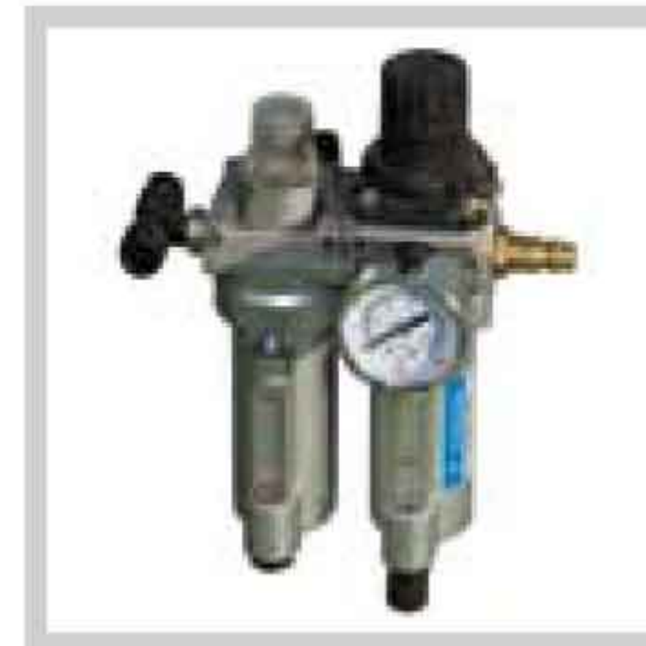
Druckluft-Wartungseinheit Service unit for compressed air Unité d'entretien air comp.