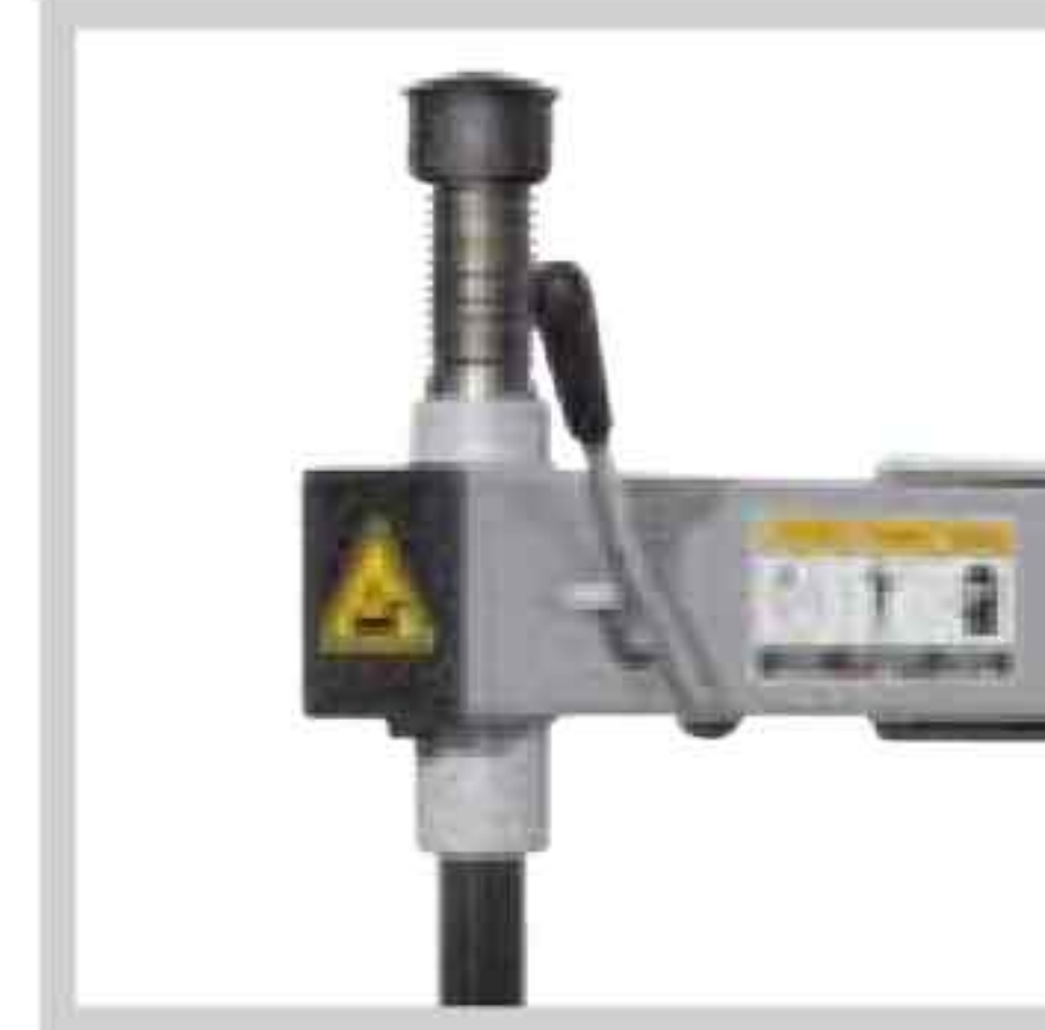
Exzenter-Verspannung Excentric clamping Bloqueur à excentrique