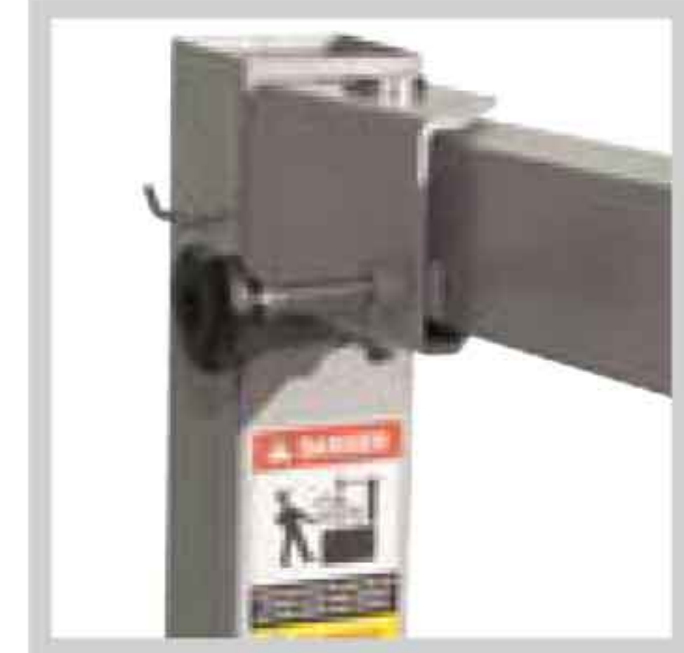
Einstellschraube Adjusting screw Vis de réglage