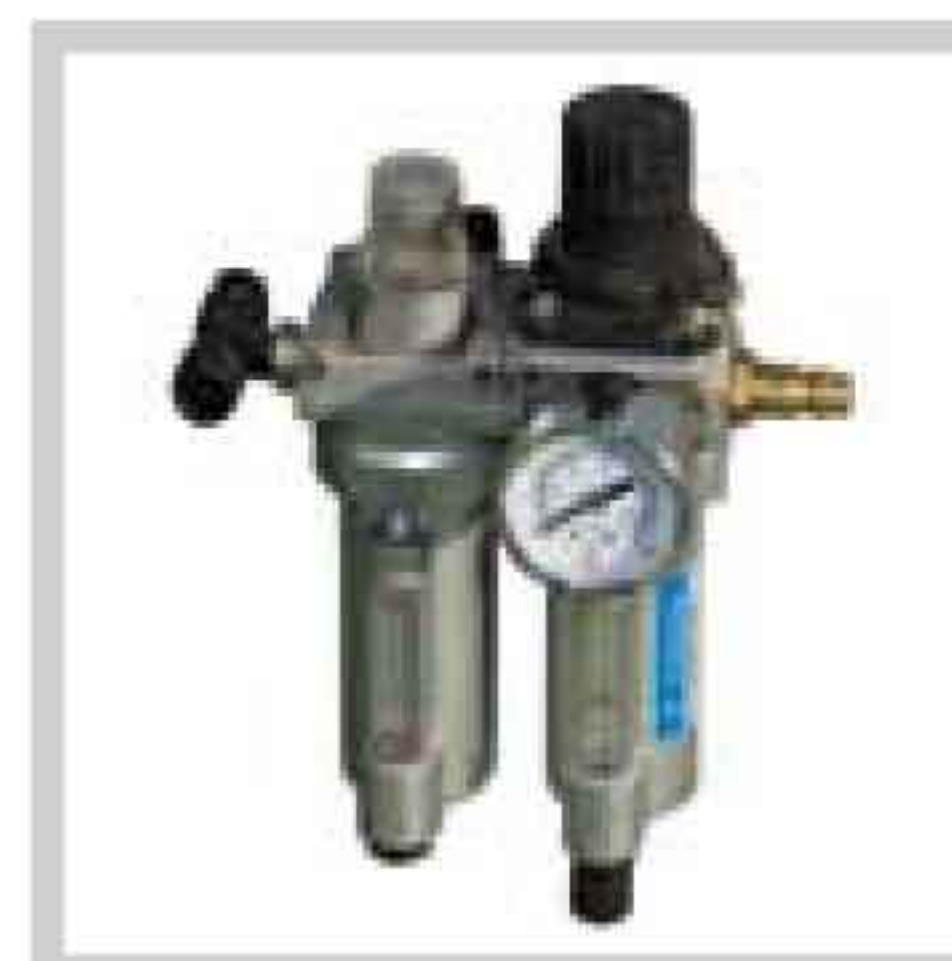
Druckluft-Wartungseinheit Service unit for compressed air Unité d'entretien air comp.