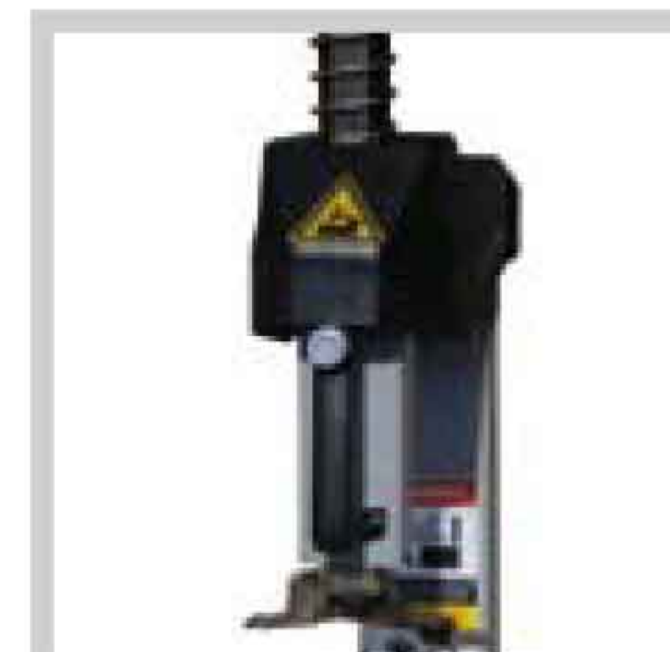
Handgriff Hand holder Poignée de blocage