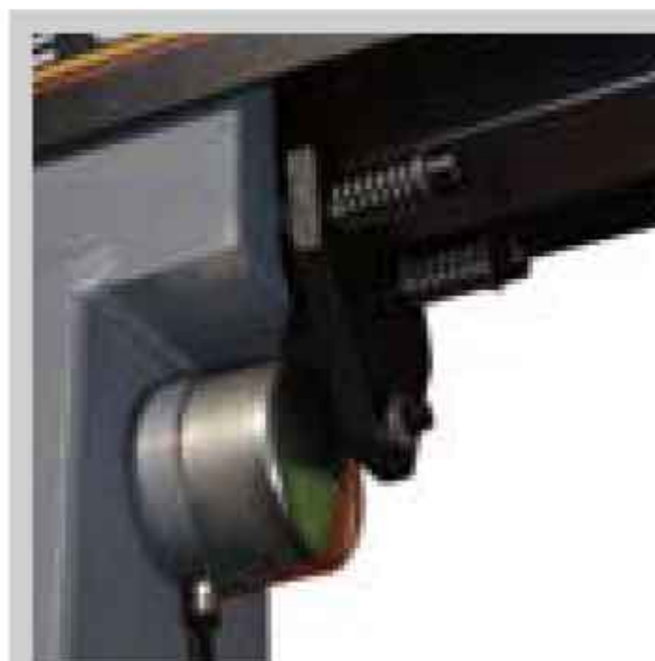
Spannzylinder Cylinder for pneumatic blocking Vérin pneumatique de blocage